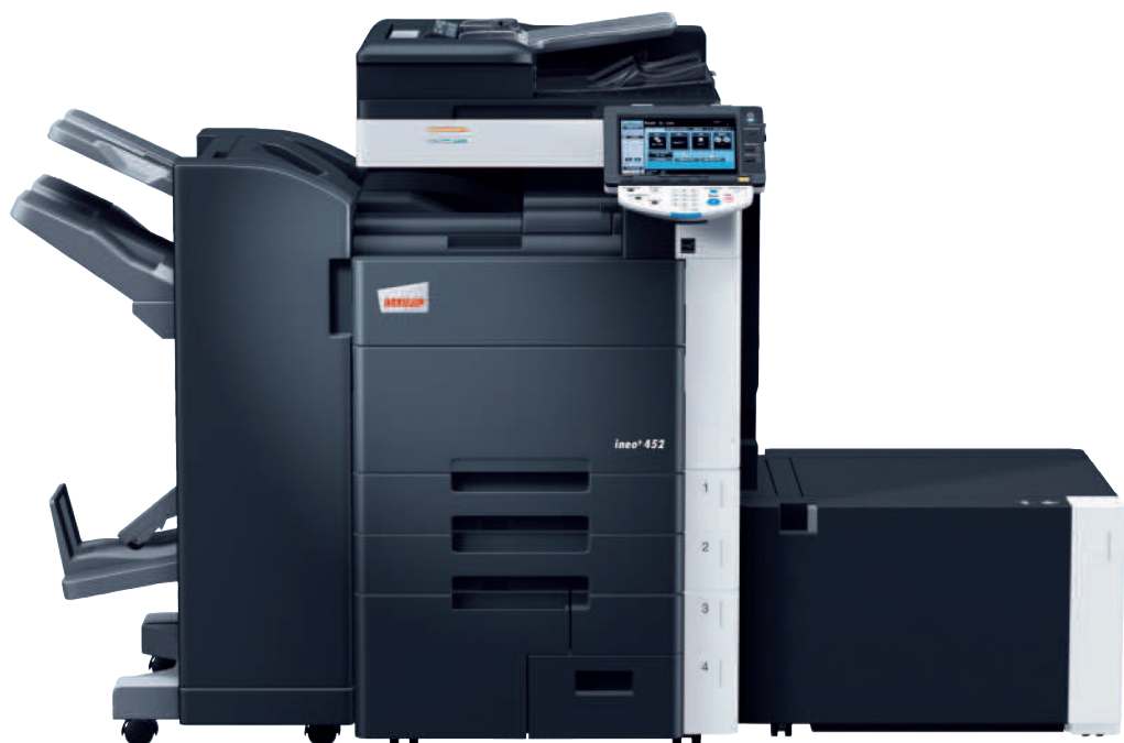
ineo+ 452 mit Heftfinisher (FS-527), Broschürenmodul inkl. Heft- und Falzeinheit (SD-509) und Großraumkassette (LU-204)