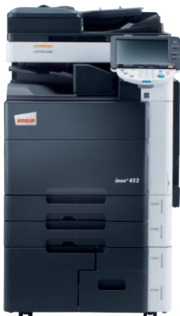
ineo+ 452 mit Job Separator (JS-504)

Wer heute verantwortungsvoll handelt, leistet seinen Beitrag für die Zukunft. Die ineo+ 452 ist ein praktisches Beispiel für den hohen Stellenwert, den der Umweltschutz bei DEVELOP hat. Sie ist mit dem blauen Umweltengel und dem Energy Star ausgezeichnet. Weil 40 Prozent weniger CO 2 bei der Herstellung des polymerisierten Toners als bei herkömmlichem Toner ausgestoßen wird. Weil mehr als 90 Prozent der Komponenten recyclefähig sind. Darüber hinaus verbrauchen die ineo-Systeme nur Energie, wenn sie laufen, und schalten sich automatisch ab, wenn sie nicht mehr in Betrieb sind.